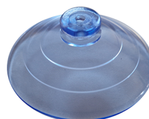
KIT ESTRAZIONE Ventosa per VITRUM 3 Cod: VITZZ011