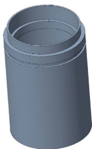
CONTROCASSA DRENANTE SLIM Controcassa drenante slim VITRUM 3 Cod: VITZZ005