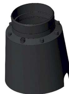
CONTROCASSA DRENANTE Controcassa drenante VITRUM 3 Cod: VITZZ002