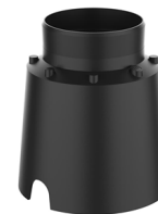
CONTROCASSA DRENANTE Controcassa drenante VITRUM 3 Cod: VITZZZ002