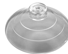
KIT ESTRAZIONE Ventosa per VITRUM 3