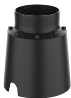
CONTROCASSA DRENANTE Controcassa drenante VITRUM 3