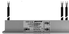
ALIMENTATORE DIMMERABILE Alimentatore 220/240 50/60Hz ON/OFF 24V 24W IP67 DALI Cod: MID0021