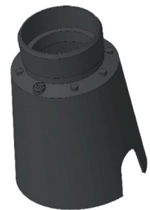
CONTROCASSA DRENANTE Controcassa drenante VITRUM 2 Cod: VITZZZ001