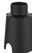
CONTROCASSA DRENANTE Controcassa drenante VITRUM 2 Cod: VITZZZ001