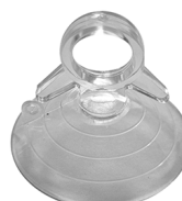
KIT ESTRAZIONE Ventosa per VITRUM 2 Cod: VITZZZ010