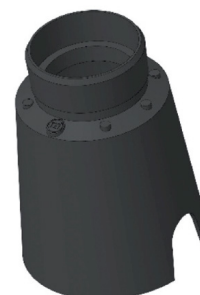
CONTROCASSA DRENANTE Controcassa drenante VITRUM 2 Cod: VITZZ001