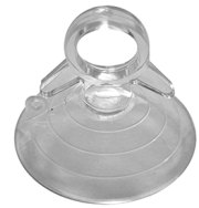
KIT ESTRAZIONE Ventosa per VITRUM 2