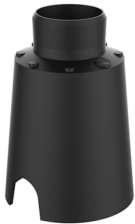
CONTROCASSA DRENANTE Controcassa drenante VITRUM 2