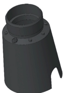
CONTROCASSA DRENANTE Controcassa drenante VITRUM 2