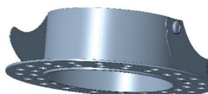
ANELLO PER CARTONGESSO Anello per cartongesso VITRUM 2