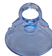
KIT ESTRAZIONE Ventosa per VITRUM 2