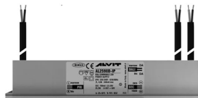
ALIMENTATORE DIMMERABILE Alimentatore 220/240 50/60Hz ON/OFF 24V 24W IP67 DALI Cod: MID0021