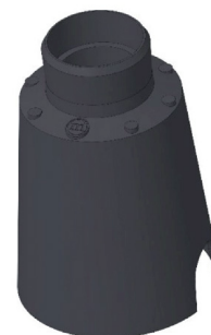
CONTROCASSA DRENANTE Controcassa drenante VITRUM 1 Cod: VITZZZ000