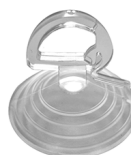
KIT ESTRAZIONE Ventosa per VITRUM 1 Cod: VITZZZ009