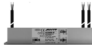
ALIMENTATORE DIMMERABILE Alimentatore 220/240 50/60Hz ON/OFF 24V 24W IP67 DALI