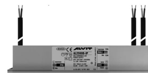
ALIMENTATORE DIMMERABILE Alimentatore 220/240 50/60Hz ON/OFF 24V 24W IP67 DALI