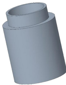
CONTROCASSA DRENANTE SLIM Controcassa drenante slim OCEANO 4