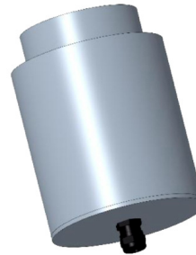
CONTROCASSA STAGNA SLIM Controcassa stagna slim OCEANO 4