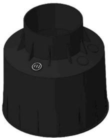
CONTROCASSA DRENANTE Controcassa drenante OCEANO 4