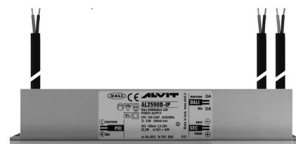
ALIMENTATORE DIMMERABILE Alimentatore 220/240 50/60Hz ON/OFF 24V 24W IP67 DALI