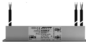
ALIMENTATORE DIMMERABILE Alimentatore 220/240 50/60Hz ON/OFF 24V 24W IP67 DALI