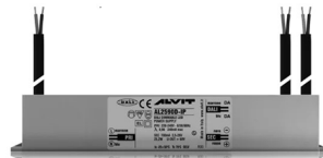
ALIMENTATORE DIMMERABILE Alimentatore 220/240 50/60Hz ON/OFF 24V 24W IP67 DALI