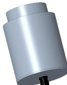
CONTROCASSA STAGNA SLIM