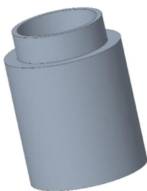
CONTROCASSA DRENANTE SLIM