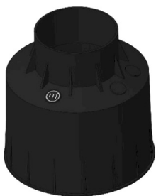
CONTROCASSA DRENANTE Controcassa drenante OCEANO 4