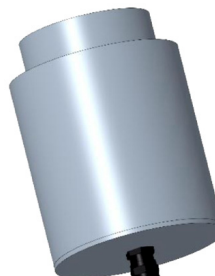
CONTROCASSA STAGNA SLIM Controcassa stagna slim OCEANO 4