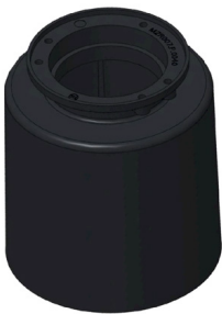
CONTROCASSA CARRABILE Controcassa carrabile OCEANO 3