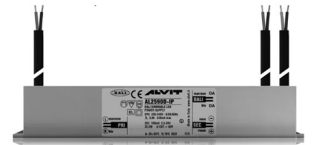
ALIMENTATORE DIMMERABILE Alimentatore 220/240 50/60Hz ON/OFF 24V 24W IP67 DALI