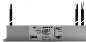
ALIMENTATORE DIMMERABILE Alimentatore 220/240 50/60Hz 24V 24W IP67 DALI