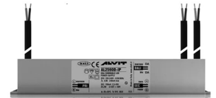
ALIMENTATORE DIMMERABILE Alimentatore 220/240 50/60Hz ON/OFF 24V 24W IP67 DALI