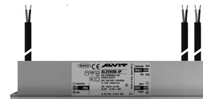
ALIMENTATORE DIMMERABILE Alimentatore 220/240 50/60Hz ON/OFF 24V 24W IP67 DALI Cod: MID0021