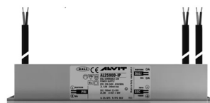
ALIMENTATORE DIMMERABILE Alimentatore 220/240 50/60Hz ON/OFF 24V 24W IP67 DALI