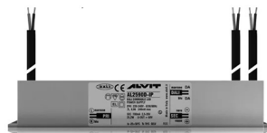
ALIMENTATORE DIMMERABILE Alimentatore 220/240 50/60Hz ON/OFF 24V 24W IP67 DALI