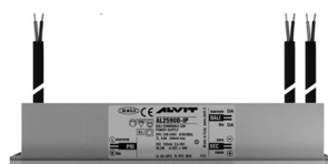
ALIMENTATORE DIMMERABILE Alimentatore 220/240 50/60Hz ON/OFF 24V 24W IP67 DALI