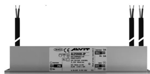
ALIMENTATORE DIMMERABILE Alimentatore 220/240 50/60Hz ON/OFF 24V 24W IP67 DALI