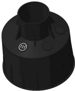
CONTROCASSA DRENANTE Controcassa drenante OCEANO 3