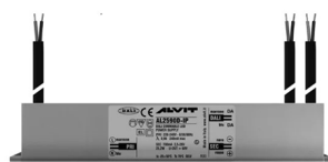
ALIMENTATORE DIMMERABILE Alimentatore 220/240 50/60Hz ON/OFF 24V 24W IP67 DALI