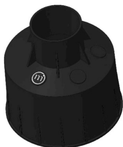
CONTROCASSA DRENANTE Controcassa drenante OCEANO 3