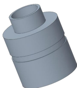
CONTROCASSA DRENANTE SLIM Controcassa drenante slim OCEANO 3