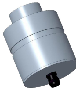
CONTROCASSA STAGNA SLIM Controcassa stagna slim OCEANO 3