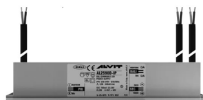
ALIMENTATORE DIMMERABILE Alimentatore 220/240 50/60Hz ON/OFF 24V 24W IP67 DALI