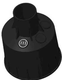
CONTROCASSA DRENANTE Controcassa drenante OCEANO 2