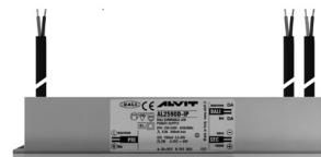
ALIMENTATORE DIMMERABILE Alimentatore 220/240 50/60Hz ON/OFF 24V 24W IP67 DALI