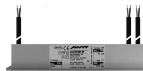
ALIMENTATORE DIMMERABILE Alimentatore 220/240 50/60Hz ON/OFF 24V 24W IP67 DALI