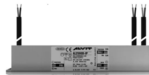
ALIMENTATORE DIMMERABILE Alimentatore 220/240 50/60Hz ON/OFF 24V 24W IP67 DALI