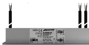
ALIMENTATORE DIMMERABILE Alimentatore 220/240 50/60Hz ON/OFF 24V 24W IP67 DALI