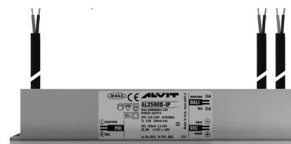
ALIMENTATORE DIMMERABILE Alimentatore 220/240 50/60Hz ON/OFF 24V 24W IP67 DALI