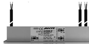
ALIMENTATORE DIMMERABILE Alimentatore 220/240 50/60Hz ON/OFF 24V 24W IP67 DALI