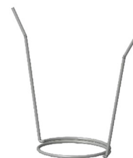
MOLLA PER FISSAGGIO SOFFITTO Molla per aggancio a soffitto OCEANO 1