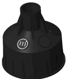
CONTROCASSA DRENANTE Controcassa drenante OCEANO 1