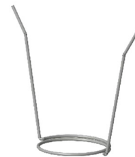
MOLLA PER FISSAGGIO SOFFITTO Molla per aggancio a soffitto OCEANO 1