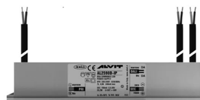
ALIMENTATORE DIMMERABILE Alimentatore 220/240 50/60Hz ON/OFF 24V 24W IP67 DALI