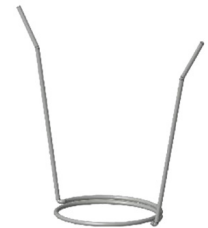
MOLLA PER FISSAGGIO SOFFITTO Molla per aggancio a soffitto OCEANO 1