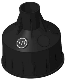
CONTROCASSA DRENANTE Controcassa drenante OCEANO 1